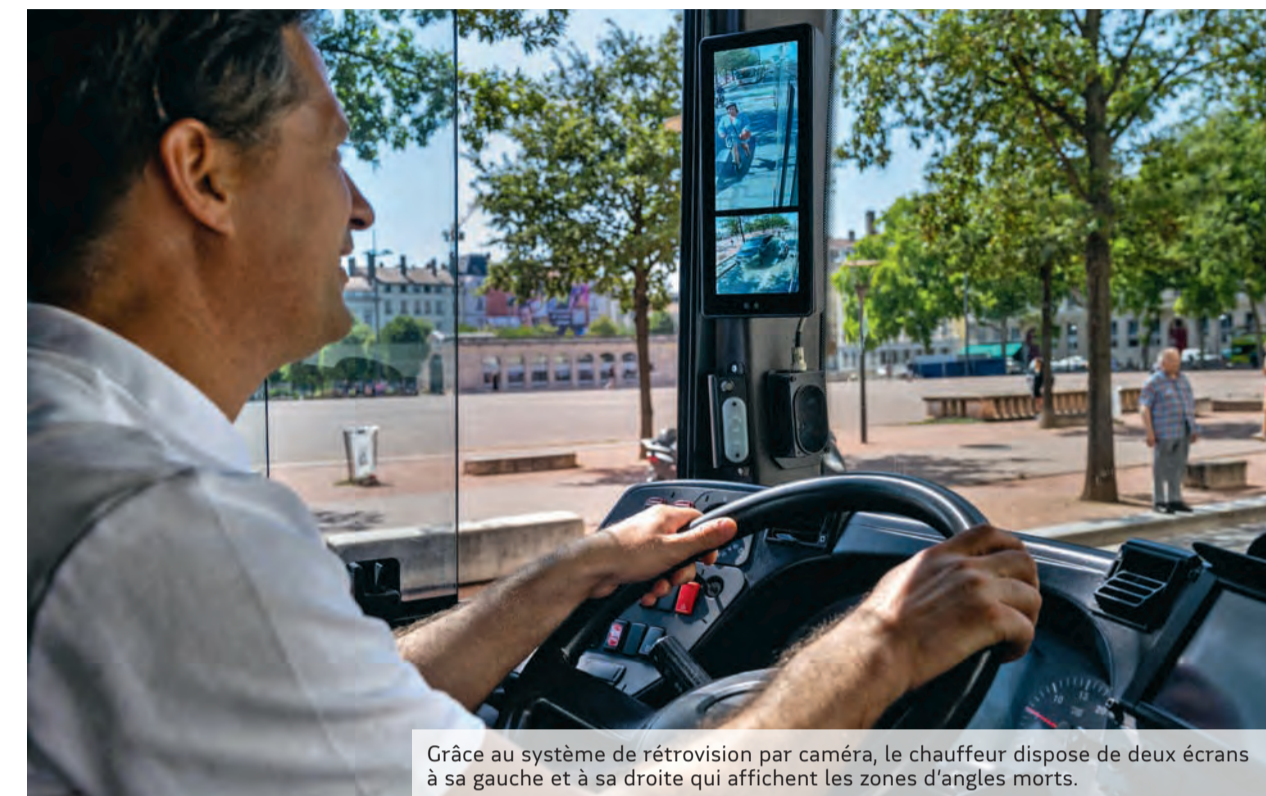
Grâce au système de rétrovision par caméra, le chauffeur dispose de deux écrans à sa gauche et à sa droite qui affichent les zones d'angles morts.

À Lyon, circulent des bus d'un nouveau genre. Testés avec succès sur la ligne 98, ils substituent un couple caméra-écran aux traditionnels rétroviseurs. Résultat : une vision sans angles morts, un vrai « plus » pour la sécurité routière !